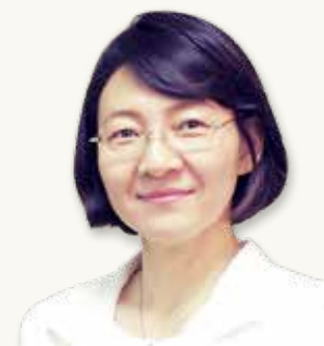
倉敷市長 伊東 香織

岡山の持つ高いポテンシャルを十分に生かすには、産官学金言の連携が不可欠であり、そのプラットフォームとして本協議体が果たす役割は非常に大きいと考えます。構成団体の皆様と連携して課題解決に尽力するとともに、政令市として地域躍進のイニシアティブを発揮してまいります。